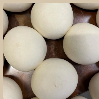
Pâton à 2.50€

Ne pas jeter sur la voie publique. Pour votre santé, mangez au moins cinq fruits et légumes par jour.